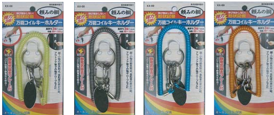
パッケージサイズ 160H×85W×8D (mm) ※台紙の変更有り

JANコード イエロー：4937747 202915 シルバー：4937747 202922 ブルー：4937747 202939 オレンジ：4937747 202946