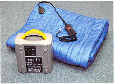
ぬくぬくブランケットDX